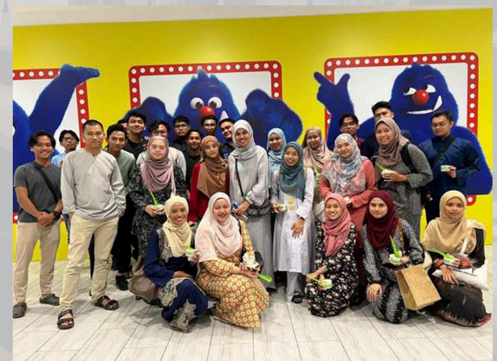
Berbuka puasa bersama staff di Johnny's Restaurant