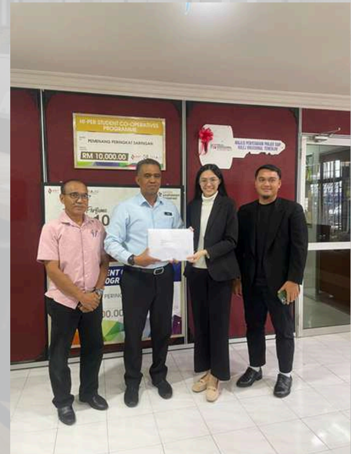
Meeting di KV Temerloh