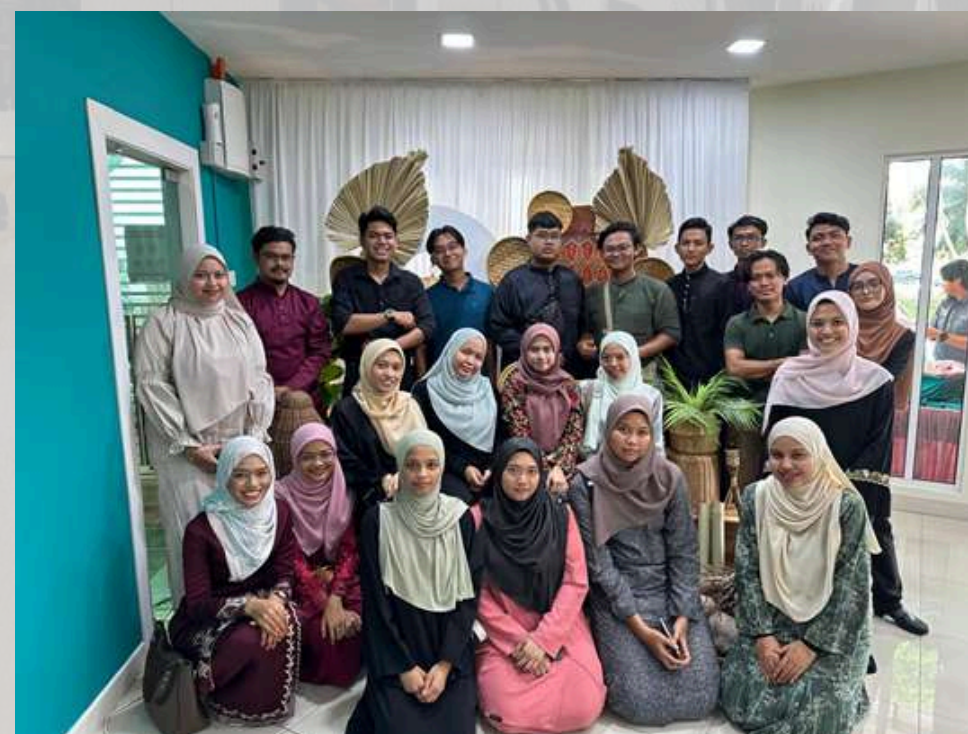
Jemputan Jamuan Raya di PUNB