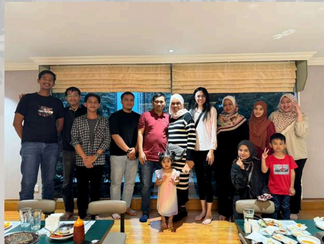
Makan Luar di Kung Jung Restaurant.