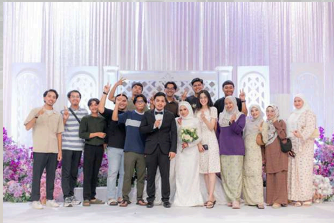
Hadir Majlis Perkahwinan Staff